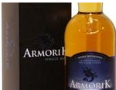
Armorik Double Malted