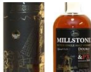
Millstone Double Sherry

Provningen äger rum i Odd Fellow lokalen på söndag den 23 oktober kl. 15.00. Anmälan till sekreteraren per e-post; mail@juhanihakkarainen.se eller tel: 073-9857366. Provningen kostar 400:- per person inkl. 6 whisky och samkväm efteråt. Drycker till middag tillkommer (lättöl/vatten ingår). Efter bekräftelsen från sekr. betalas avgiften - per person till vårt plusgiro nr. 39 07 33-4 i förskott. Max. antal deltagare 35 personer.