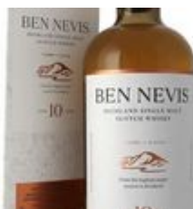
Ben Nevis Single Malt 10 yo