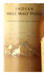
Amrut Regular Single Malt